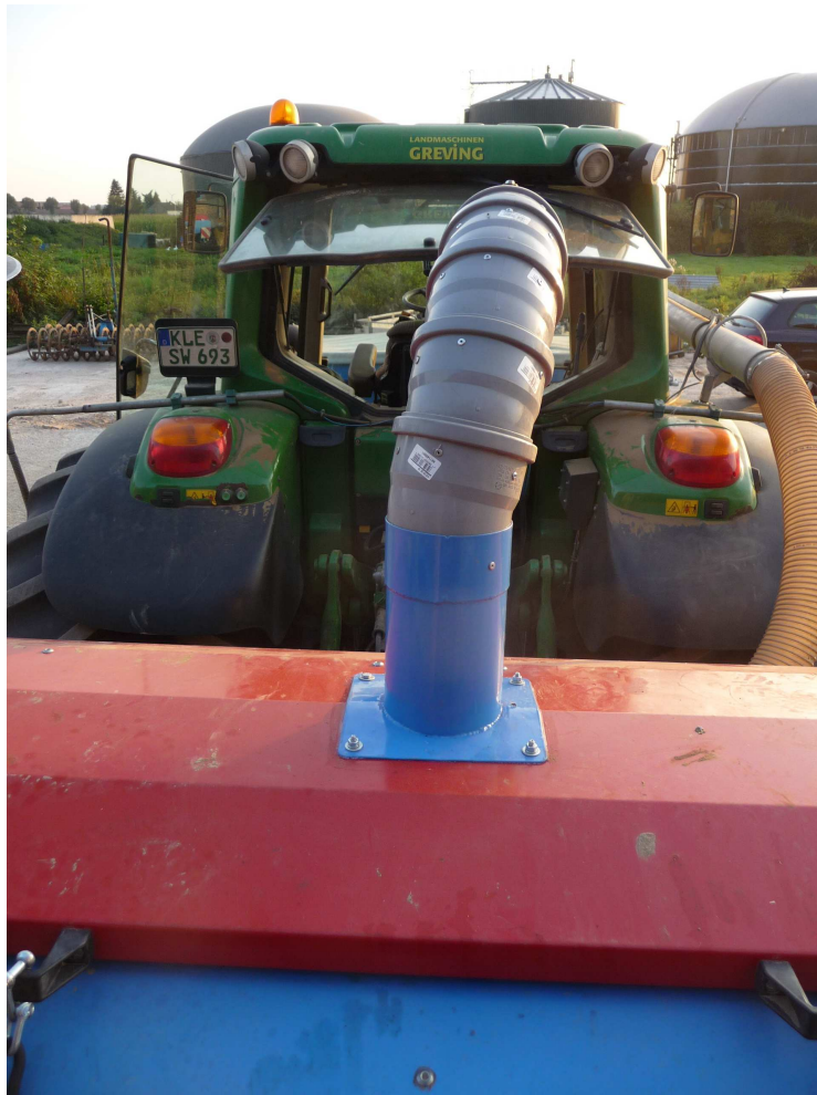
Zusatzrüstung pneumatisch Umladen - Förderleitung Ø125 mm - Rohrbogen mit Verteilblech im Sägerät, montiert im Sägeräte-Deckel