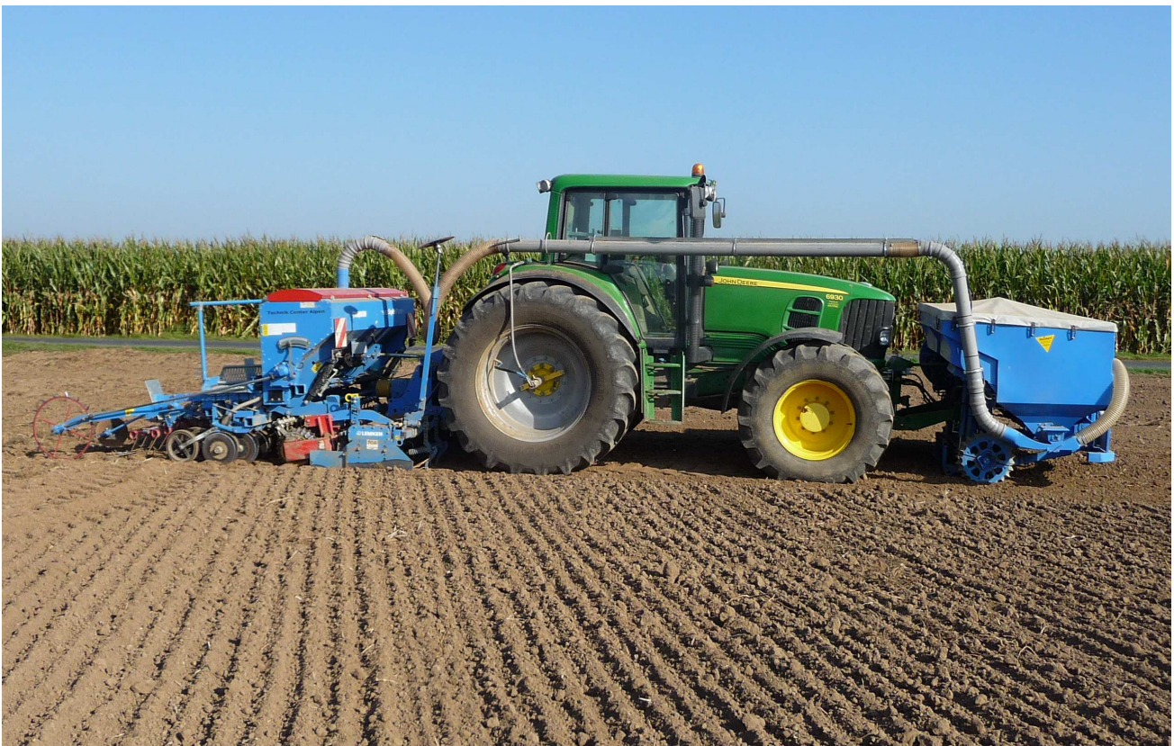
Fronttank FT 2527 mit Schneckendosierung Inhalt 2700 Liter, Tankbreite 2,50 m ➤ mit Zusatzausrüstung pneumatisch Umladen, Förderleitung Ø125 mm - in Kombination mit mechan. Sägerät - Rohrbogen mit Verteilblech im Sägerät - mit Walze (Wunschausrüstung)