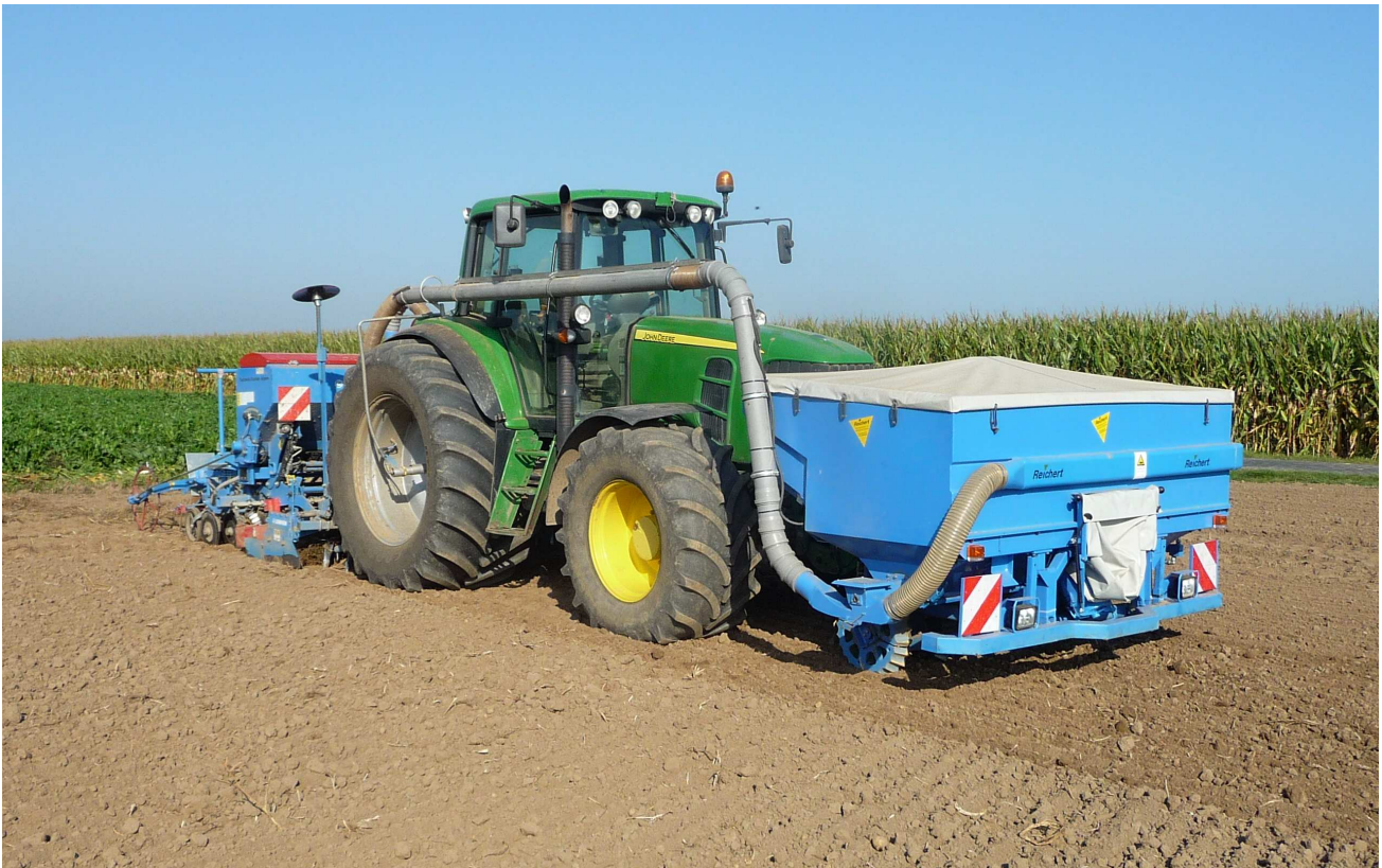
Fronttank FT 2527 mit Schneckendosierung Inhalt 2700 Liter, Tankbreite 2,50 m ➤ mit Zusatzausrüstung pneumatisch Umladen, Förderleitung Ø125 mm - in Kombination mit mechan. Sägerät