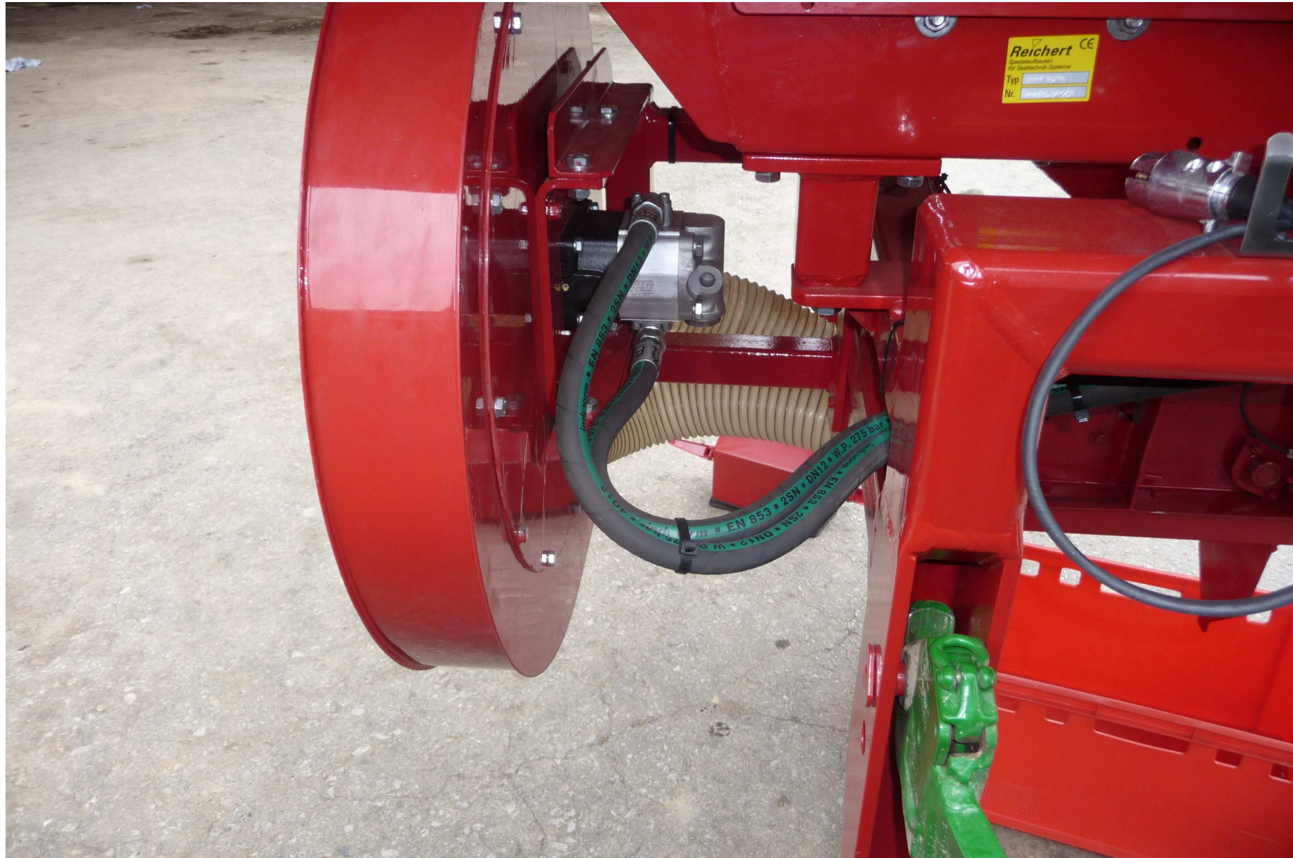
Front-Drucktank konisch FDTK 2526W - mit Gebläse und Hydraulikantrieb, links am Tank