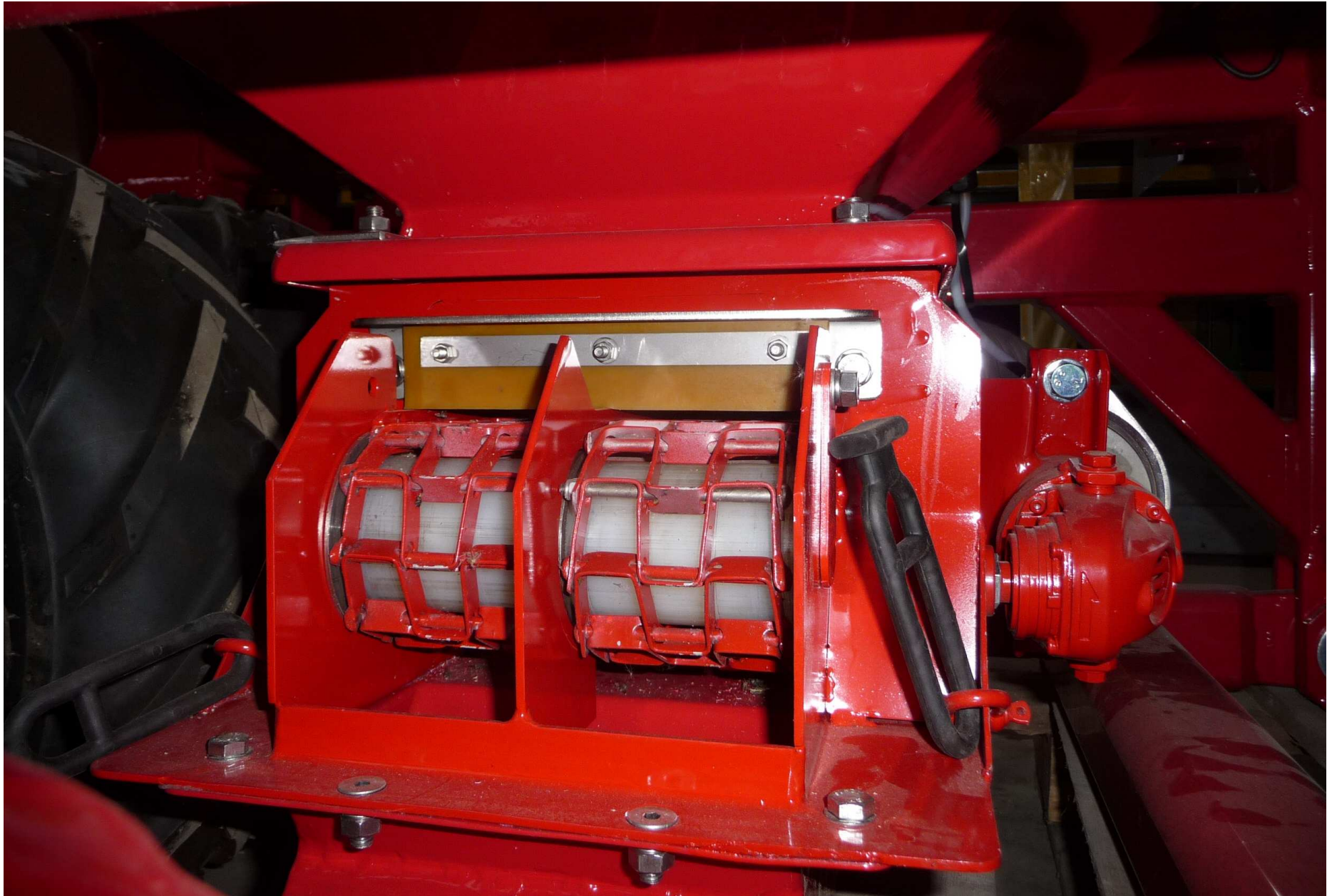
Wabenketten-Dosierung, el. angetrieben, Rechner gesteuert - bei abgenommener Schutzhaube - speziell für Dünger und Getreide - ein- und zweizügige Dosierkette