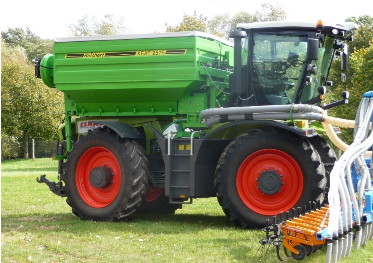
Aufbautank XEAT 2575 Inhalt 7500 Liter, Tankmaße innen 2,5 m Breite x 3,0 m Länge - mit 2 Förderleitungen Ø125 mm oder 160 mm - max. Förderleistung bis 8 t/h oder 12 t/h → in Kombination mit Hacke und Düngesystem