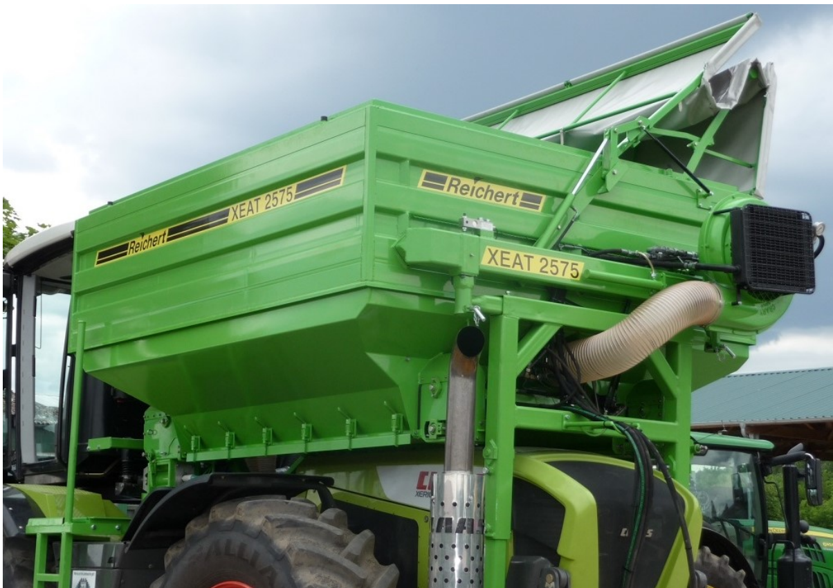
Aufbautank XEAT 2575 Inhalt 7500 Liter, Tankmaße innen 2,5 m Breite x 3,0 m Länge - mit 2 Förderleitungen Ø125 mm oder 160 mm - max. Förderleistung bis 8 t/h oder 12 t/h - mit hydraulisch klappbaren Planedach