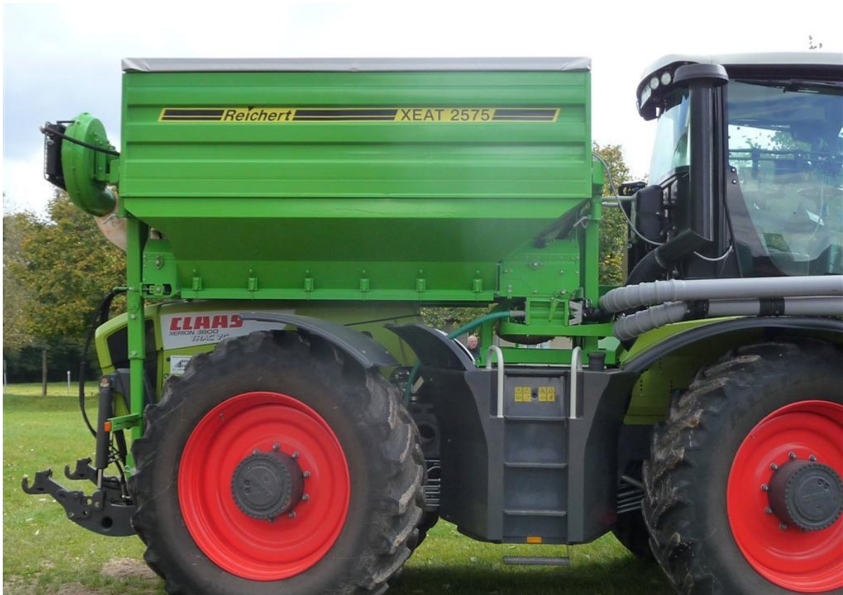
Aufbautank XEAT 2575 Inhalt 7500 Liter, Tankmaße innen 2,5 m Breite x 3,0 m Länge - mit 2 Tankausläufen mit separat gesteuerten Kettendosierungen → aufgebaut auf Claas Xerion 3800 Trac VC