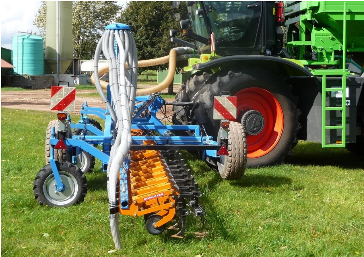
Aufbautank XEAT 2575 Inhalt 7500 Liter, Tankmaße innen 2,5 m Breite x 3,0 m Länge - mit 2 Düngerverteilern Ø125 mm oder 160 mm - max. Förderleistung bis 8 t/h oder 12 t/h → in Kombination mit Hacke 12 m