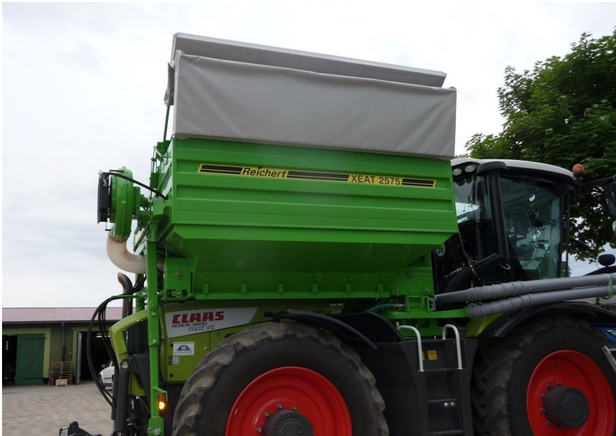
Aufbautank XEAT 2575 Inhalt 7500 Liter, Tankmaße innen 2,5 m Breite x 3,0 m Länge - mit 2 Förderleitungen Ø125 mm oder 160 mm - max. Förderleistung bis 8 t/h oder 12 t/h - mit hydraulisch klappbaren Planedach, ganz offen