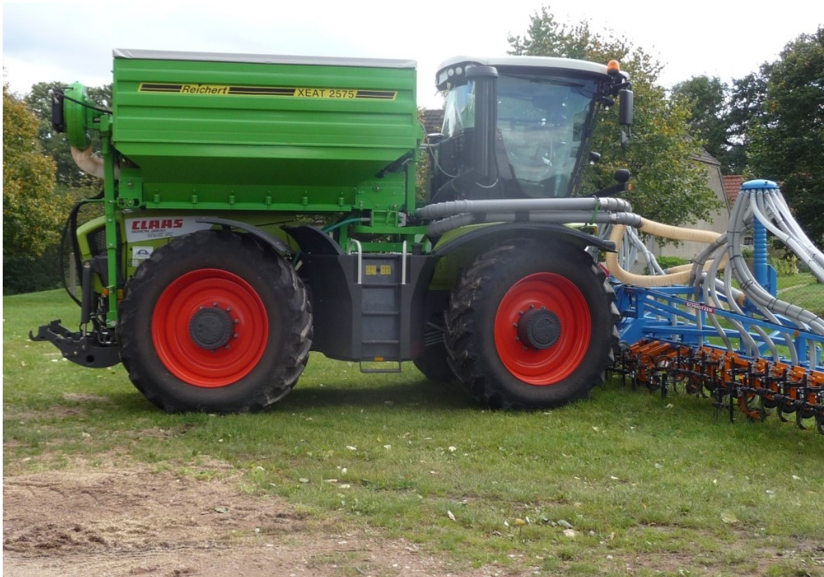
Aufbautank XEAT 2575 Inhalt 7500 Liter, Tankmaße innen 2,5 m Breite x 3,0 m Länge - mit 2 Förderleitungen Ø125 mm oder 160 mm - max. Förderleistung bis 8 t/h oder 12 t/h → in Kombination mit Hacke 12 m und Düngesystem