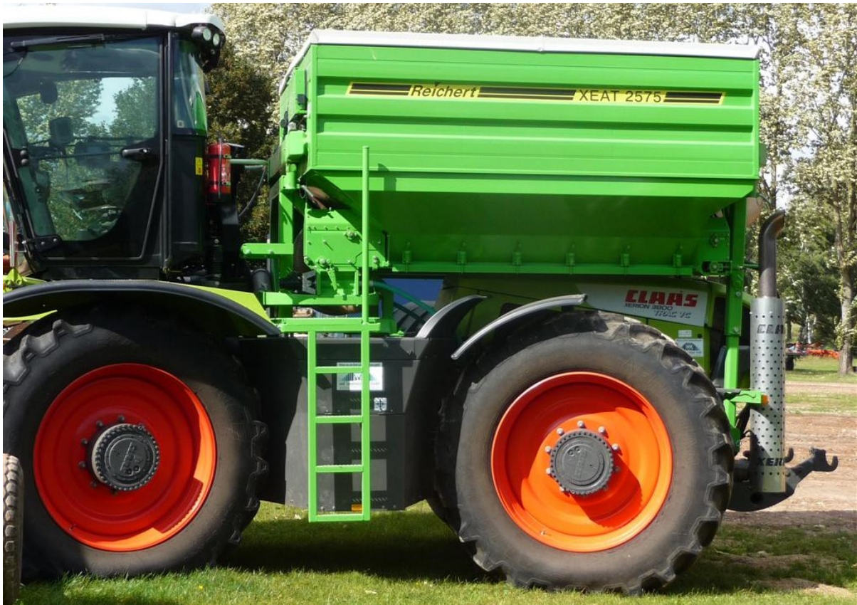
Aufbautank XEAT 2575 Inhalt 7500 Liter, Tankmaße innen 2,5 m Breite x 3,0 m Länge - mit 2 Förderleitungen Ø125 mm oder 160 mm - max. Förderleistung bis 8 t/h oder 12 t/h - mit Leiter - mit hydraulisch klappbaren Planedach