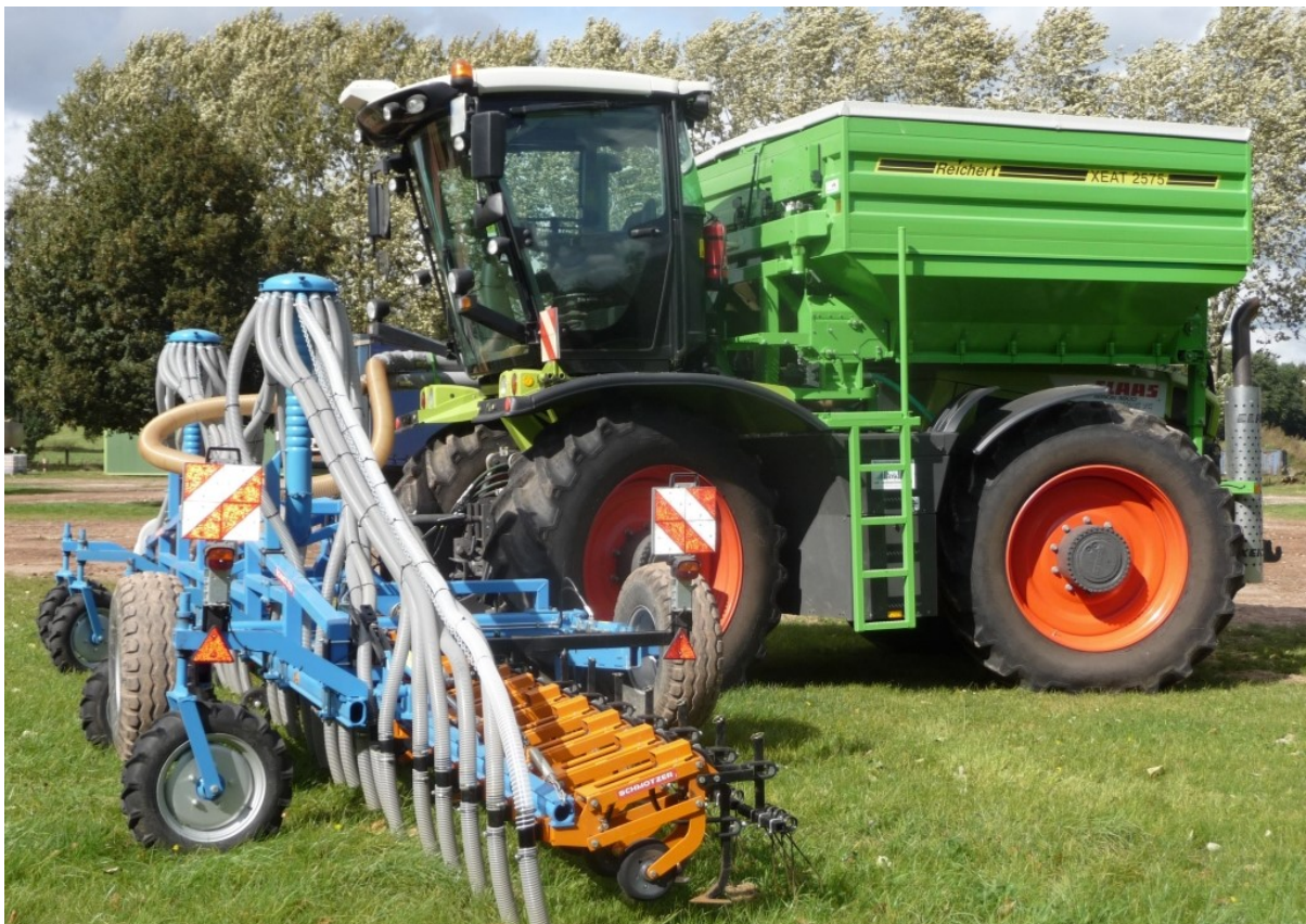
Aufbautank XEAT 2575 Inhalt 7500 Liter, Tankmaße innen 2,5 m Breite x 3,0 m Länge - mit 2 Förderleitungen Ø125 mm oder 160 mm - max. Förderleistung bis 8 t/h oder 12 t/h → in Kombination mit Hacke 12 m und Düngesystem