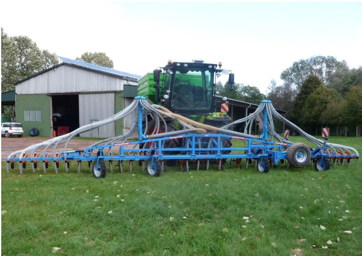
Aufbautank XEAT 2575 Inhalt 7500 Liter, Tankmaße innen 2,5 m Breite x 3,0 m Länge - mit 2 Düngerverteilern Ø125 mm oder 160 mm - max. Förderleistung bis 8 t/h oder 12 t/h → in Kombination mit Hacke 12 m