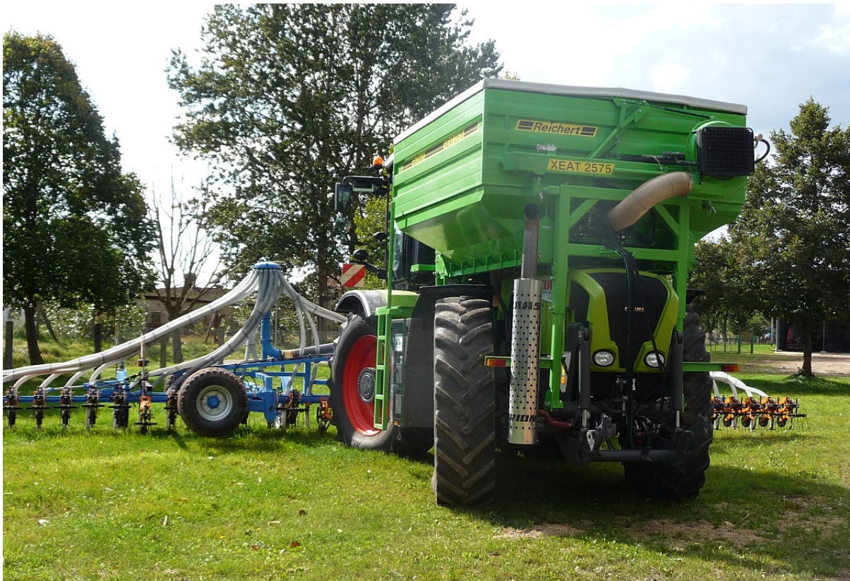
Aufbautank XEAT 2575 Inhalt 7500 Liter, Tankmaße innen 2,5 m Breite x 3,0 m Länge - mit 2 Tankausläufen mit separat gesteuerten Kettendosierungen - mit 2 Förderleitungen Ø125 mm oder 160 mm - max. Förderleistung bis 8 t/h oder 12 t/h