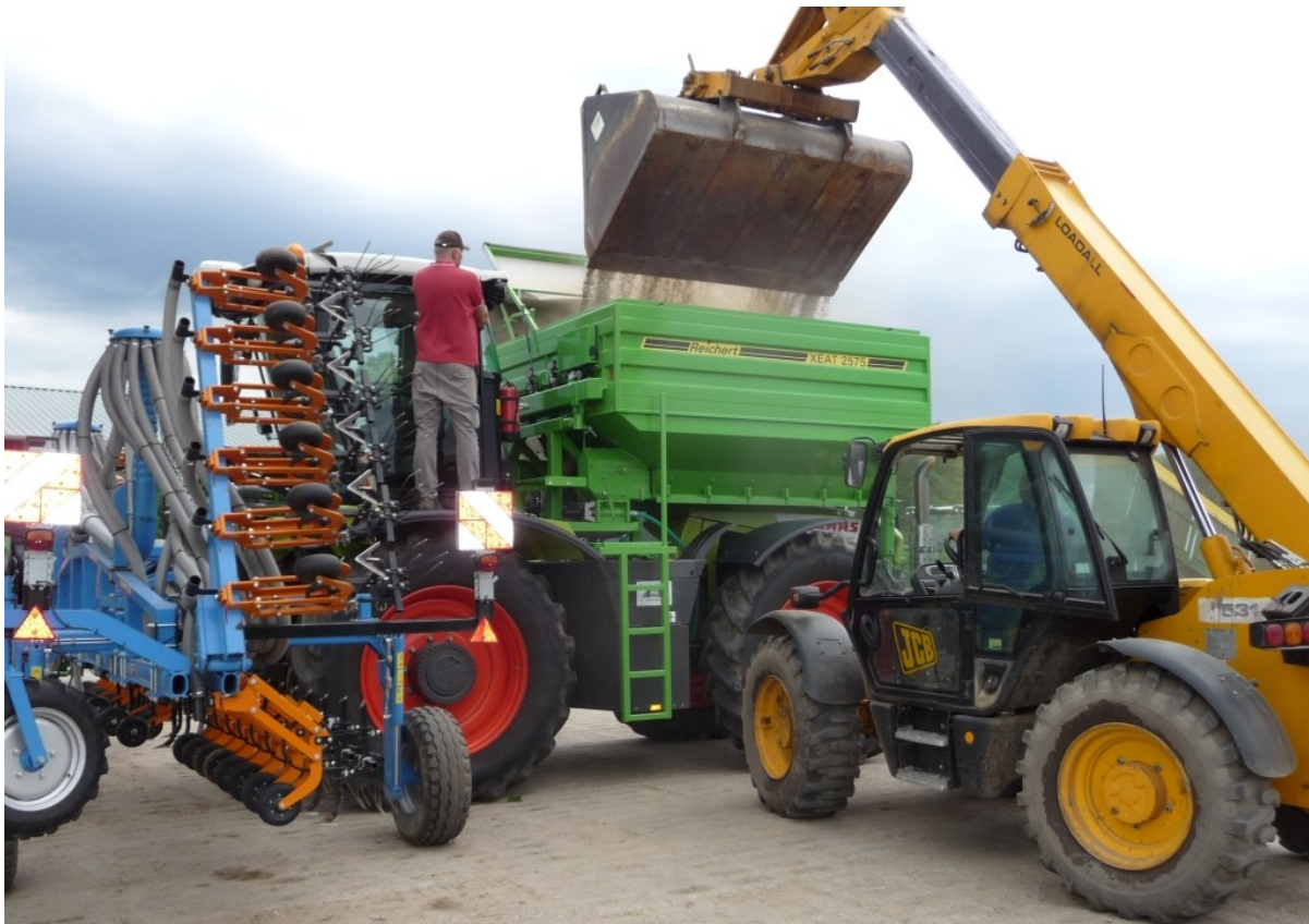
Aufbautank XEAT 2575 Inhalt 7500 Liter, Tankmaße innen 2,5 m Breite x 3,0 m Länge - mit hydraulisch klappbaren Planedach - große Tanköffnung mit 2,5 m Breite und 3,0 m Länge → schnelle Befüllung mit Teleskoplader möglich